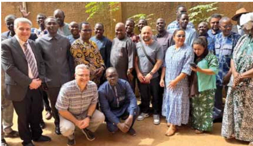
la delegazione ADI con il Consiglio Nazionale delle AD del Niger

segreteriaibi@assembleedidio.org www.istitutobiblicoitaliano.it 06 228 0291