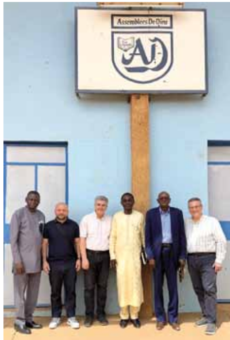
Foto insieme ad alcuni membri del Consiglio Generale delle AD del Niger davanti alla chiesa centrale di Niamey.