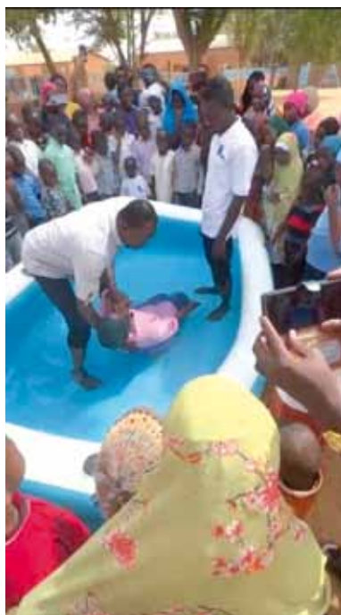
Momento dei battesimi

bili dei vari dipartimenti delle Assemblee di Dio del Niger. Il fratello Fragnito ha condiviso il tema: “Un buon ministro di Cristo Gesù”. La delegazione DME ha fatto una visita alla scuola primaria “Maranà” delle Assemblee di Dio del Niger, che vede la presenza di 320 bambini nella fascia d’età dai 5 ai 12 anni. 51 di questi provengono dall’orfanotrofio delle AD del Niger “Il Buon Samaritano” e attualmente 24 alunni fanno parte del programma ADI-AID. Gli spazi sono pochi e la scuola è in procinto di completare delle nuove strutture appena ci sarà copertura finanziaria adeguata. Anche l’orfanotrofio è stata una tappa dell’itinerario della delegazione ADI, istituto oggetto del sostegno di singole chiese e dell’opera ADI. Anche questa volta le chiese curate dai pastori della delegazione hanno provveduto all’acquisto di beni di prima necessità. Qui vi sono 96 ospiti, spesso bambini abbandonati appena nati, non riconosciuti o non voluti dai loro genitori. L’accoglienza da parte dei bambini è stata festosa e si è potuto partecipare, per l’occasione, a un culto di battesimi.