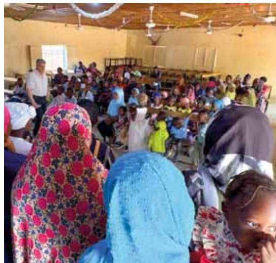
Visita all'orfanotrofio "Il Bon Samaritain" delle AD del Niger