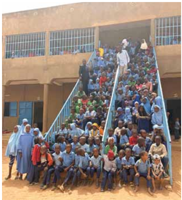
Scuola Primaria “Maranata” delle AD del Niger, con 320 alunni

Oltre alla partecipazione alla conferenza, la delegazione italiana ha incontrato il Consiglio Nazionale, organo ufficiale delle Assemblee di Dio del Niger, composto dai membri del Consiglio Generale, dai presidenti delle regioni e i responsa-