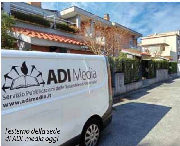
l'esterno della sede di ADI-media oggi