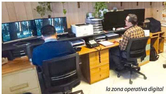
la zona operativa digital

Centro Kades onlus Regione Basso Erro 41 15010 Melazzo (AL) Tel.0144.41222 - fax 0144.41182 centrokades@gmail.com www.centrokades.org