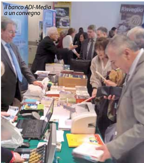
il banco ADI-Media a un convegno