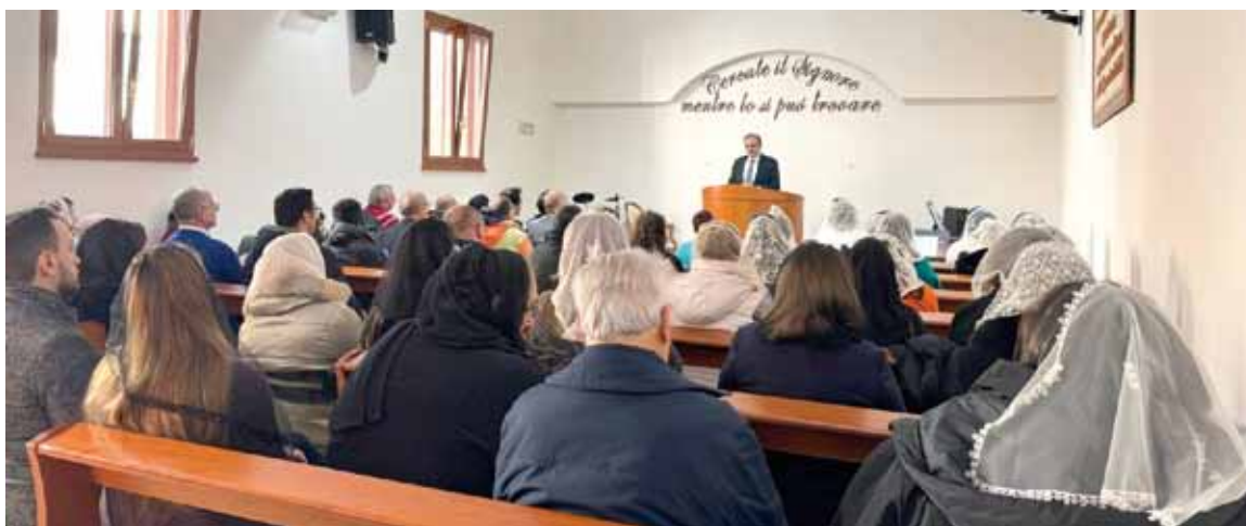
il locale di culto a Triggiano oggi

1924 il fratello Francesco Giancaspero che svolse tale incarico sino al 1965. Ma a causa dell'iniqua circolare Buffarini Guidi del Ministero dell'Interno del 9 aprile 1935 fu arrestato il 22 novembre 1939, mandato al confino per tre anni e destinato nell'isola di Ventotene.