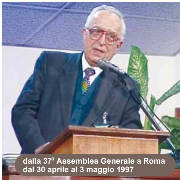
dalla 37 a Assemblea Generale a Roma dal 30 aprile al 3 maggio 1997