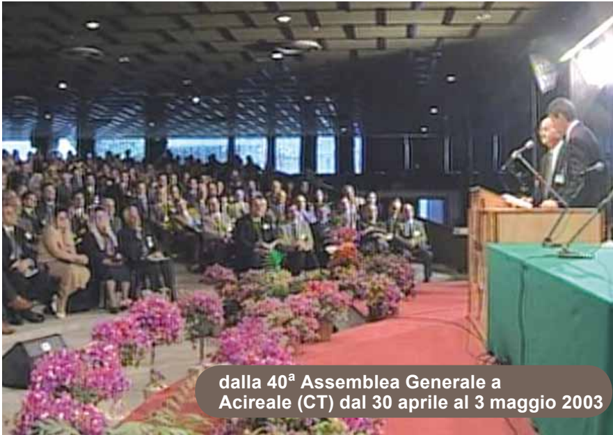
dalla 40 a Assemblea Generale a Acireale (CT) dal 30 aprile al 3 maggio 2003

ti e molti altri li hanno seguiti, a cominciare da coloro che erano presenti all'Assemblea costitutiva delle ADI nel 1947.