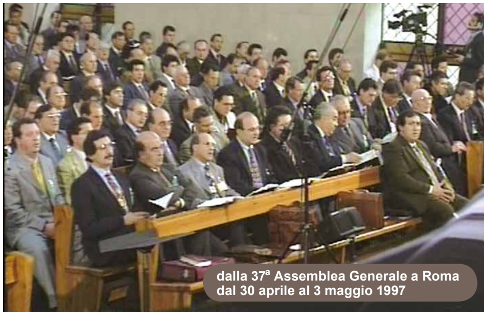
dalla 37ª Assemblée Generale a Roma dal 30 aprile al 3 maggio 1997

Se hai accettato Gesù come tuo Salvatore, potrai rivolgerti a Lui in ogni momento, per ogni cosa, ringraziandolo con tutto il cuore, perché "in nessun altro è la salvezza" (Atti 4:12). "Se con la bocca avrai confessato Gesù come Signore e avrai creduto con il cuore che Dio lo ha risuscitato dai morti sarai salvato" (Romani 10:9). "Credi nel Signore Gesù e sarai salvato tu e la tua famiglia" (Atti 16:31).