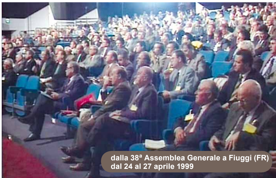
dalla 38ª Assemblée Generale a Fiuggi (FR) dal 24 al 27 aprile 1999

Gli anni della marcia verso il riconoscimento giuridico del Movimento furono lunghi e difficili, ma esperti che curarono e seguirono l'iter burocratico e soprattutto il Signore sensibilizzò il cuore di eminenti personalità del mondo giuridico, intellettuale e politico del nostro Paese, che levarono la voce in favore della libertà di culto.