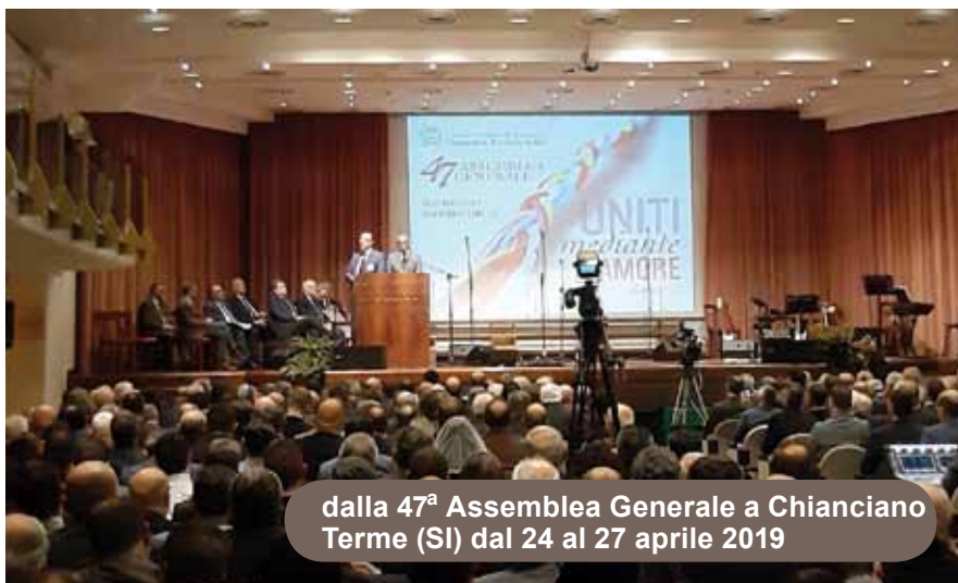
dalla 47 a Assemblea Generale a Chianciano Terme (SI) dal 24 al 27 aprile 2019

adattato da un articolo scritto dal fratello Francesco Toppi per la 40 a Assemblea Generale del 2003