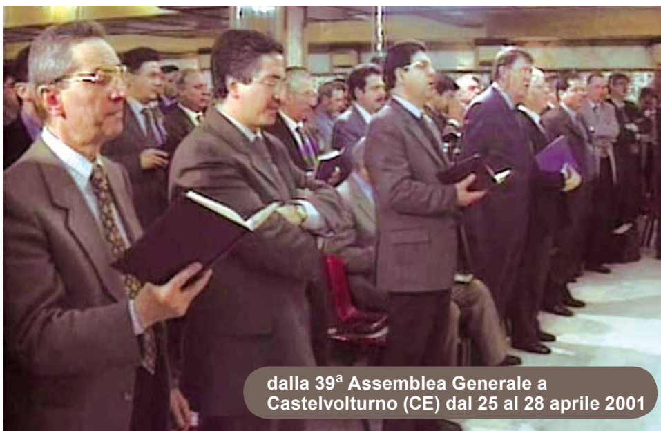
dalla 39 a Assemblea Generale a Castelvoturno (CE) dal 25 al 28 aprile 2001

Il numero delle comunità raddoppiò e furono adottate iniziative di grande valore come la pubblicazione del mensile "Risveglio Pentecostale", dei Manuali per le Scuole Domenicali , così come la costruzione dell'edificio che avrebbe ospitato fino al 2016 l' Istituto Biblico Italiano , del Villaggio Betania per gli orfani e, poco dopo, di Casa Emmaus , casa di riposo