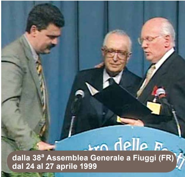
dalla 38 a Assemblea Generale a Fiuggi (FR) dal 24 al 27 aprile 1999

Soltanto nel 1955 fu annullata l'infamante circolare che aveva ordinato lo scioglimento del Movimento e infine, dopo aver superato con l'aiuto del Signore ostacoli e lungaggini burocratiche, si riuscì a ottenere il riconoscimento delle ADI come Ente Morale di culto , con Decreto del Presidente della Repubblica del 5 dicembre 1959, n.1349.