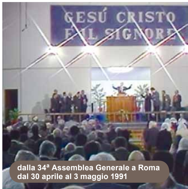
dalla 34 a Assemblea Generale a Roma dal 30 aprile al 3 maggio 1991

L' Assemblea Generale delle "Assemblee di Dio in Italia" è costituita dai rappresentanti di chiese ed è l'organo legislativo dell'Ente, ma soprattutto riveste un'ulteriore e importante possibilità d'incontro fraterno tra i ministri di culto che svolgono il proprio servizio nell'annuncio dell'Evangelo ai perduti, nonché nella cura e nell'edificazione delle comunità locali, secondo le prerogative proprie del ministero cristiano e gli scopi dell'Ente, così come recita l'Art.4 dello Statuto. Infatti, si rivela sempre un'occasione per rinsaldare i legami cristiani e fraterni nella comune vocazione di fedeltà all'annuncio dell'Evangelo, perché possiamo "stare perfettamente uniti in una medesima mente e in un medesimo sentire" (I Corinzi 1:10), "impegnando(ci) per conservare l'unità dello Spirito con il vincolo della pace" (Efesini 4:3).